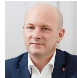
Joachim Wolbergs Brücke

*OB-Kandidierende der derzeit im Stadtrat vertretenen Fraktionen